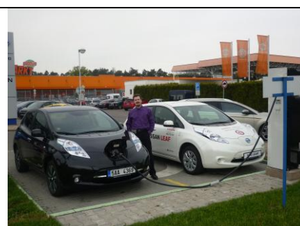
Na rychlonabíječce vedle dalšího předváděcího Leafa