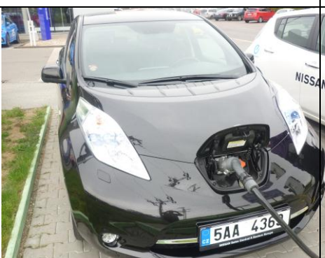
Čerpáme elektrickou energii