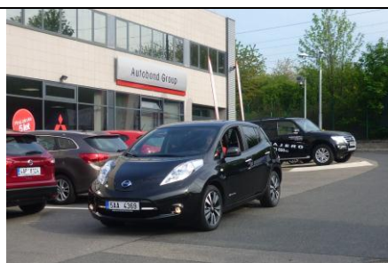
Přijíždí budoucí „náš“ Nissan Leaf

APEL ČR (Asociace pro elektromobilitu České republiky; www.elektromobily-os.cz ); www.spszr.cz