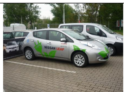
Předváděcí Leaf v Pardubicích