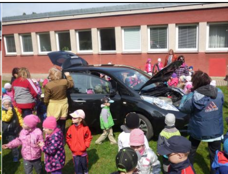
Kde má motor?