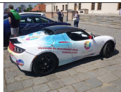
Elektromobil TESLA Roadster