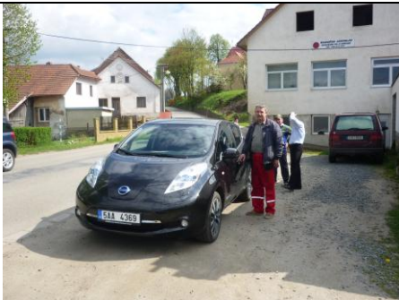
Předváděčka v Bobrové