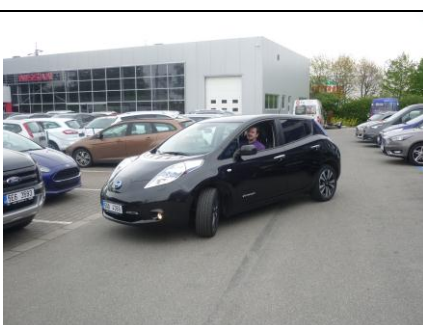
Ruda jede na rychlobabiječku