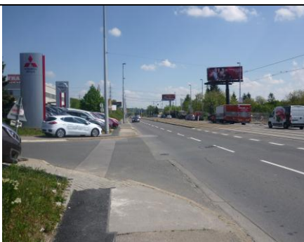
Zleva výjezd od Autobond – před týdnem jsme vyjžděli doleva a rovnou přes tramvajový pás!