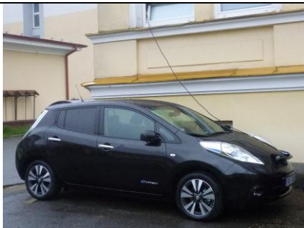
Nabíjení z okna na průmyslovce