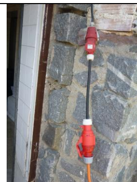
Vyrobili jsme různé redukce na kabel a jsme všude kompatibilní!