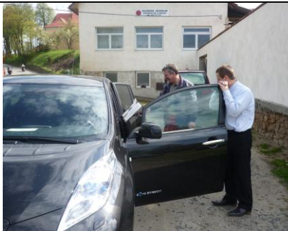
Pro Rudu poslední předváděčka – pak už jen rozloučení s vozem