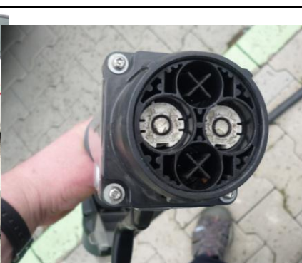
Zástrčka CHAdeMO rychlonabíječky