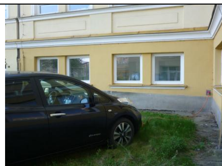
Nabíjení na dvoře průmyslovky www.spszr.cz