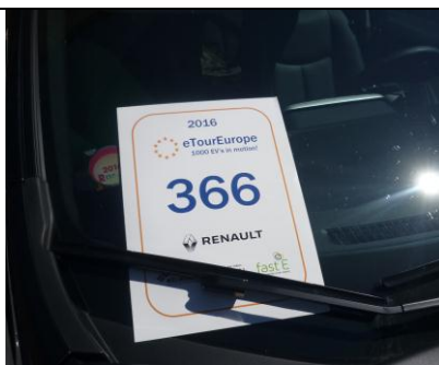
Naše registrační číslo 366 1000 EVs in motion!