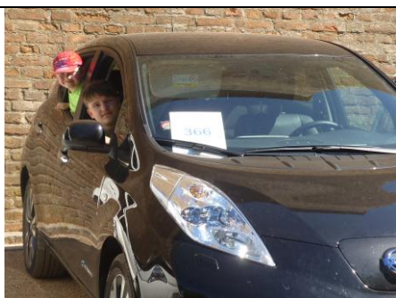
Jsme zaregistrováni v rámci e-Tour 2016 v akci 1000 EVs in motion!