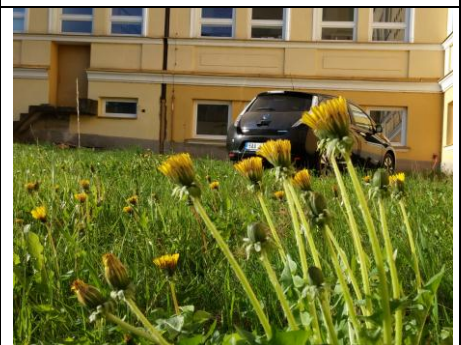
Děkujeme za týden tiché jízdy bez spalin z výfuku!