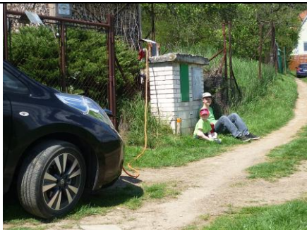
Pohoda při nabíjení v zelené přírodě