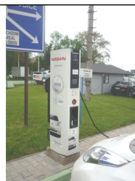
Rychlonabíjecí stojan CHAdeMO