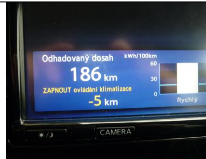
Klimatizace ubere 5 km z dojezdu