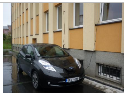
První nabíjení v ZR – kabel z okna