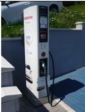
Rychlonabíječka u Autobond Group v Praze – Kolbenově ulici