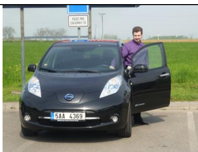
První zastávka za Prahou - Nehvizdy