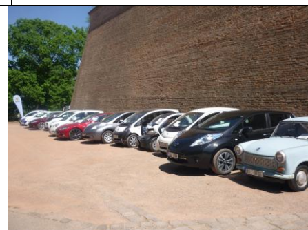
Stojíme vedle e-Trabanta – přestavba na elektromobil