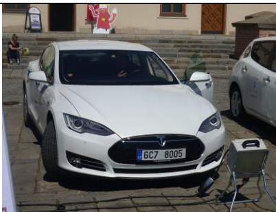
V Brně na Špilberku nechyběla TESLA model S – majitel E.ON