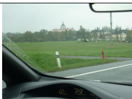
Příjezd Leafu do Žďáru – Zelená hora