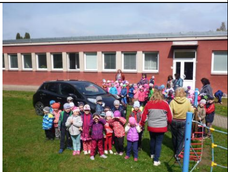
Nissan tiše přijel mezi děti do MŠ