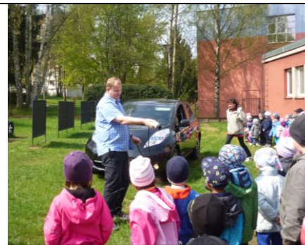
Tohle je kabel na dobíjení baterie