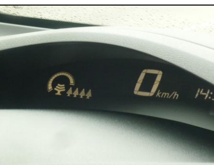
ECO jízdou „stavíme“ stromečky