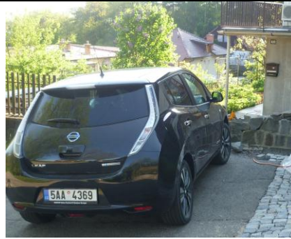
Bučovice – ENERGIS 24 www.energis24.cz