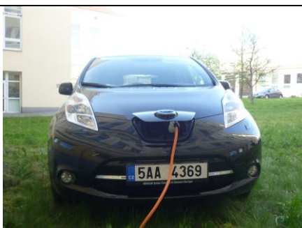
Kabel umožňuje nabíjet všude