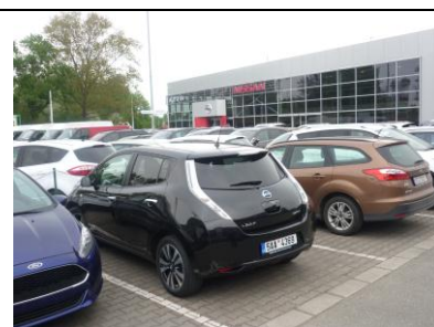
Nissan Pardubice – AUTO IN