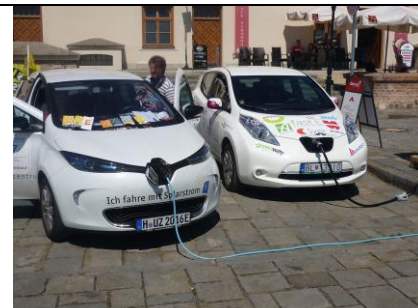
Nabíjení - Renault ZOE a Nissan Leaf (posádky elektro-rallye e-TOUR 2016)