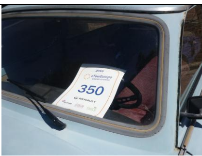
registrační číslo Trabanta 350