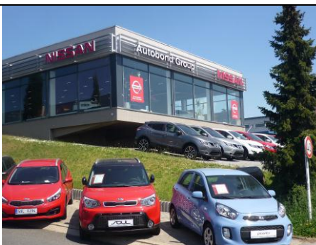
Showroom Nissan - Autobond Group od nabíjecího místa