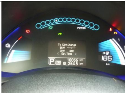
Palubní deska – dojezd 186 km