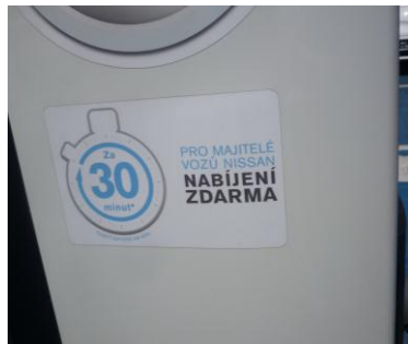
30 minut nabíjení zdarma