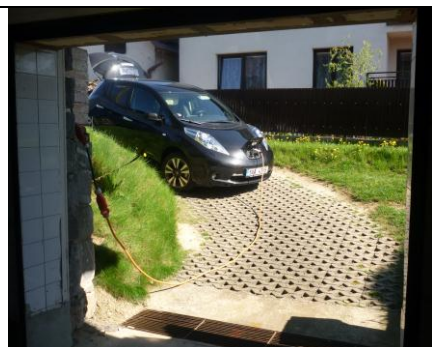
Nabíjení u Rudy doma