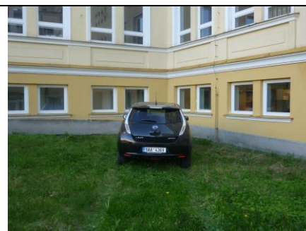
Koleje v trávě k „nabíječce“