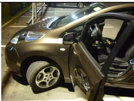
Nissan Leaf před odjezdem z Brna

APEL ČR (Asociace pro elektromobilitu České republiky; www.elektromobily-os.cz )