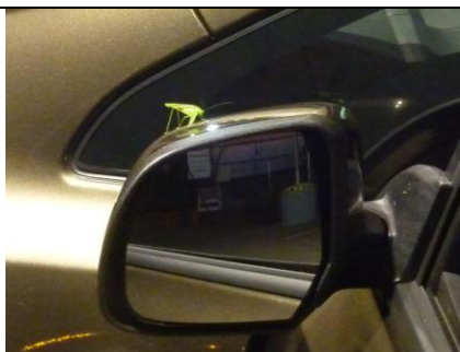
Na zrcátku před odjezdem přistál luční koník – příroda a EKOauto