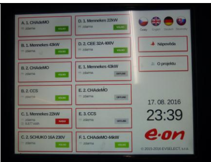
Ovládací displej nabíječek na centrálním stojanu na Vystrkově

Děkujeme značce Nissan ČR a firmě Autobond Group a. s. Praha za půjčení elektromobilu Nissan Leaf !