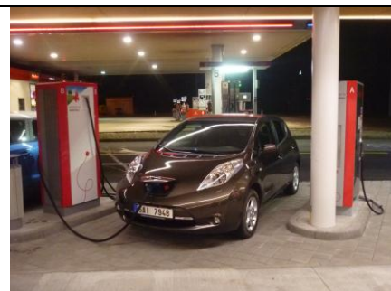
Už jsme na Vystrkově u Humpolce (90. km D1) a dobíjíme