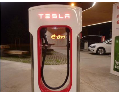
Snoubení firmy a značky na Vystrkově