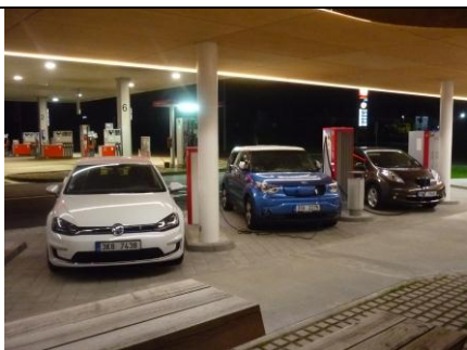
Nabíjelo nás více najednou (VW e-Golf, Kia Soul EV a náš Leaf)