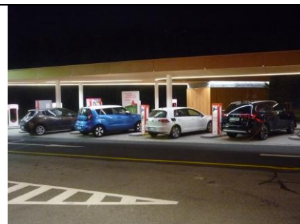
Na Vystrkově za tmy (úrodička elektromobilů)